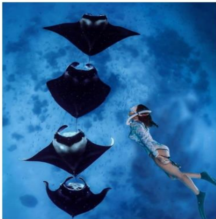
蝠魞出沒 (manta ray, 俗稱魔鬼魚)

最溫馴的鯊魚護士鯊，用吸食方法進食，吸力相當於12台吸塵器，它的鼻孔前端有一對會顫抖的鼻須，使其能夠準確判斷食物位置，然後一鼓作氣吸進獵物，這種進食就好像護士清理垃圾廢物一樣敏捷，所以得名護士鯊。它們體長大約三米左右，體重可達100公斤，外形憨態可掬，性情溫順，不會主動攻擊人類。