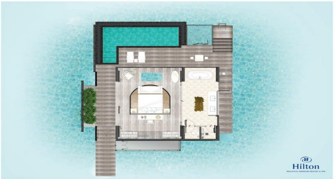
One-Bedroom Overwater Pool Villa